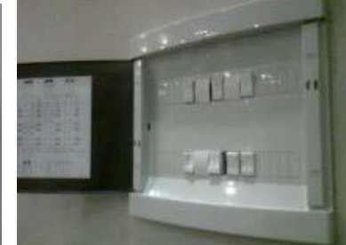
Tablero con IM y Pulsadores de 10A