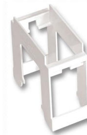
Adaptador riel DIN