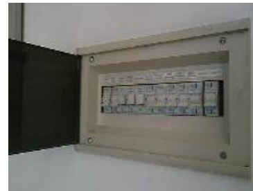
Tablero con IM y Pulsadores de 32A